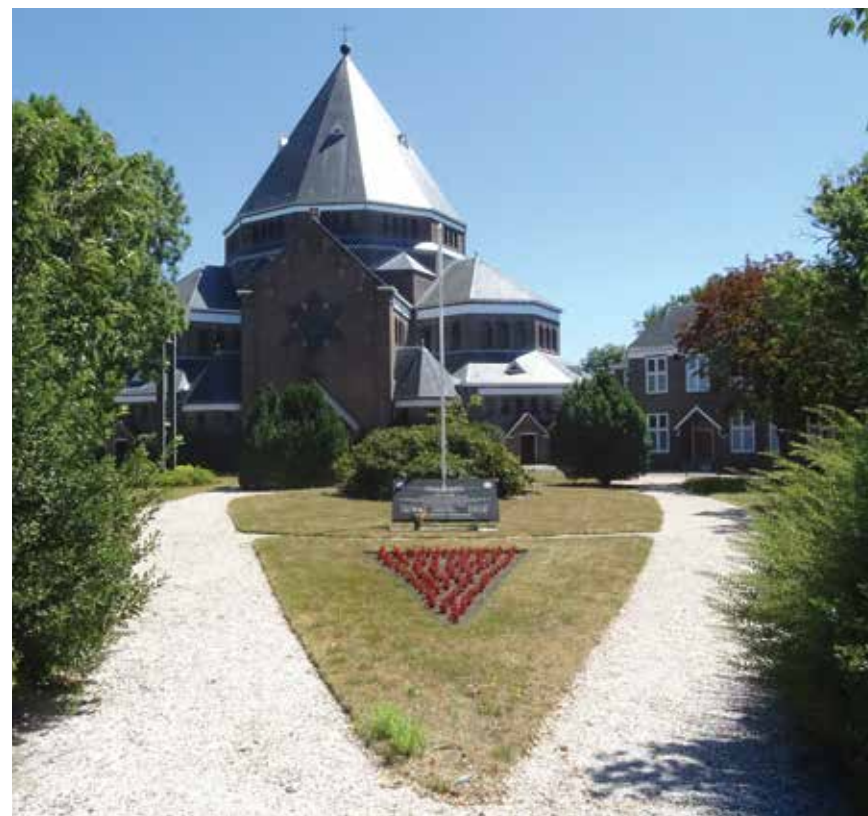
Nog elk jaar wordt de crash herdacht bij het monument