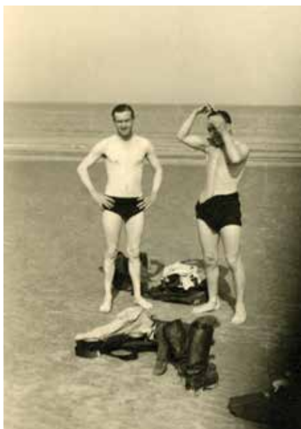
Tot 1942 werd het strand door de militairen nog gebruikt om te baden