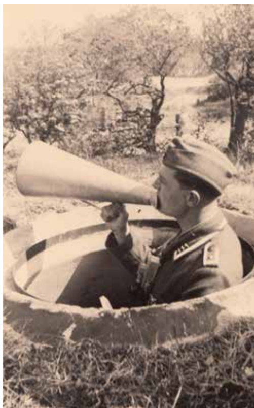
Een Duitse militair roept bevelen door vanuit een Tobruk

Onder het zand en tussen de duindoorns liggen nog een aantal goed verborgen bunkers en stukken van open loopgraven van een stelling die het meest noordelijke deel van het verdedigingsgebied rondom Katwijk en Noordwijk moest beschermen. De loopgraven werden door de Duitse troepen met de hand gegraven en versterkt met zandzakken, hout, vlechtwerk of plaggen. Naast het wandelpad, links van de fietsenstalling, ligt nog een betonnen bunkertje dat zichtbaar is vanaf het voetpad. Dit type bouwwerk wordt ook wel een Tobruk genoemd, vernoemd naar de Libische plaats waar ze in 1941 voor het eerst door het Italiaanse leger werden gebouwd. Een schutter kon beschermd vanuit deze bouwwerken 360 graden rondom vuren, waardoor het een uiterst effectief ontwerp was. Er zijn duizenden exemplaren van gebouwd in de Atlantikwall.