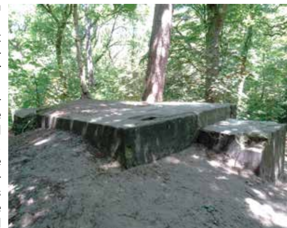
Bunker als vleermuisonderkomen

Het was een erg groot complex waar eind 1944 zelfs een hoofdkwartier werd gevestigd en meer dan 200 militairen verbleven. Tijdens de naoorlogse herstelwerkzaamheden zijn de meeste verdedigingswerken verwijderd en zijn nieuwe bomen geplant. Wat nu nog resteert zijn enkele bakstenen bunkers die tegenwoordig in gebruik zijn als vleermuisonderkomen. Als je de wandelroute op het landgoed volgt, kom je er enkele van tegen.