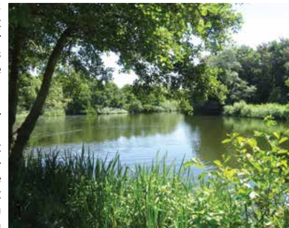
De voormalige tankgracht als natuurvijver

Het landgoed 'Nieuw Leeuwenhorst' kent een roerige geschiedenis. De naam stamt af van het klooster dat hier in de 13e eeuw vlakbij lag. In de Tachtigjarige Oorlog werd het vernietigd. De naam bleef voortbestaan en de gronden van het klooster werden in de 17e eeuw het decor van buitenplaatsen die rijke lieden uit de steden hier lieten bouwen. Op het terrein van een van deze landgoederen werd in 1880 een nieuw landhuis gebouwd dat de naam 'Huize Leeuwenhorst' kreeg. Lang konden de bewoners niet van het pand genieten. Volgens de Duitse plannen lag het landgoed midden in het tracé van de nieuw te graven tankgracht van het Landfront van de Stützpunktgruppe Katwijk. In 1943 werd het landhuis gesloopt en het oude bos gekapt. De grote vijver die midden op het landgoed ligt is een sterk aangepast deel van de oorspronkelijke tankgracht.