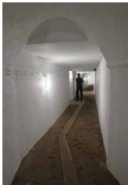
Eén van de gangen die de bunkers met elkaar verbonden

verder ook bakstenen wateropslagbunkers, een keukengebouw en houten douchebarak. Al met al zijn er gedurende de oorlog ruim 80 bouwwerken verezen voor de aanwezige 180 soldaten.