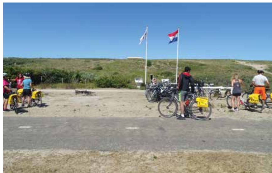
Een druk bezochte dag bij het museum, tussen de vlaggen ligt de ingang

Vervolg de weg richting KP 32. Aan je rechterzijde zie je het houten hek van de ingang van het Atlantikwall Museum Noordwijk.