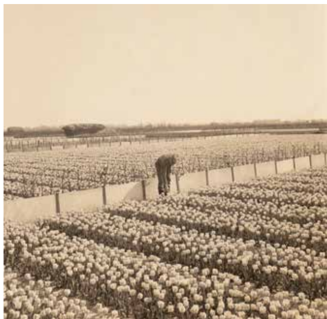
Duitse militair in de omgeving van Lisse kijkt de tulpenvelden

Vervolg de weg en sla bij de rotonde LA de Hoofdweg op, dit wordt later de Heereweg. Na 650 meter zie je rechts de grote Engelbewaarderskerk en een pad naar het B17-monument dat direct in het plantsoen voor de kerk staat.