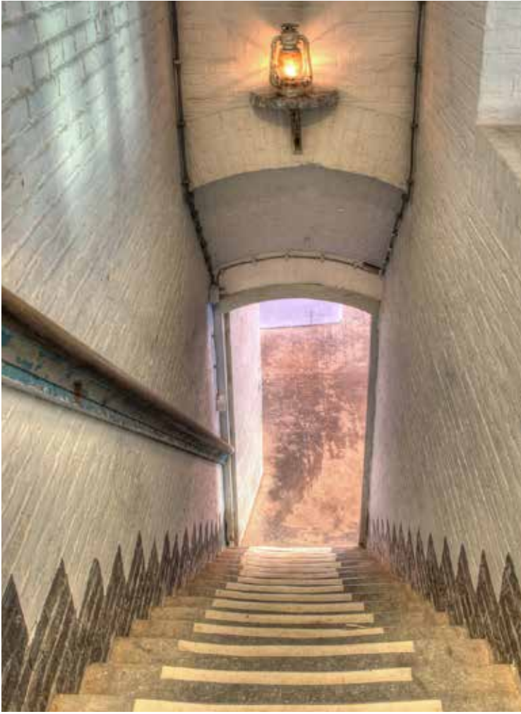
LINKS: FORT BIJ ABCOUDE.