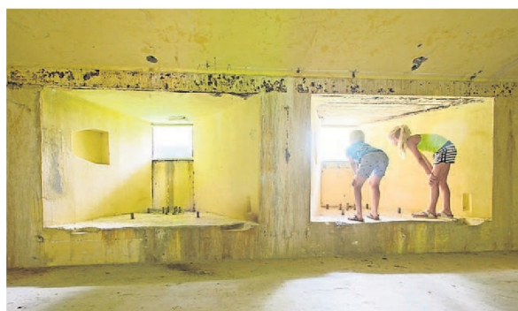
Koekeloeren door oude kanonsopeningen in het Fort bij Edam.

wachter doe ik het beheer van het fort er eigenlijk als hobby bij, samen met de vrijwilligers. Ik ben gek op het fort. Die betonnen kracht, dat robuuste, de ligging in de natuur... Het is een passie. Maar ik denk dat dat voor alle fortwachters in Nederland geldt!" ♦