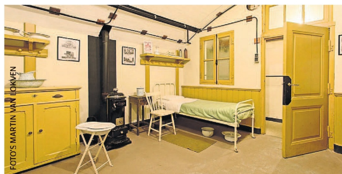
Bezoekers van het Fort bij Edam kunnen - wanneer het weer open gaat - zien hoe het soldatenverblijf er vroeger uit zag.