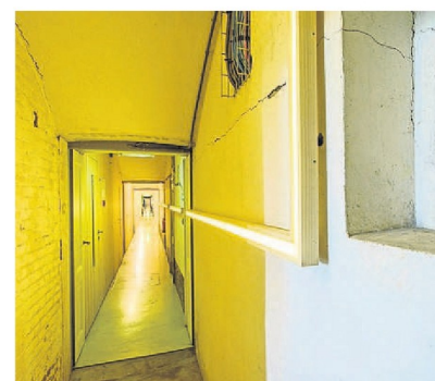
Ruimte zat in Fort K'IJK voor allerlei initiatieven.

Want uiteindelijk bleken de twee de fortwachterswoning te kunnen betrekken. Een gloednieuw pand: het oude fortwachtershuis was in de jaren tachtig gesloopt. Geheel in stijl opgetrokken, met alleen maar natuurlijke materialen ontworpen door niemand minder dan Piet Hein Eek. Annemijn houdt zich vooral bezig met de netwerkondersteuning van de horeca, het